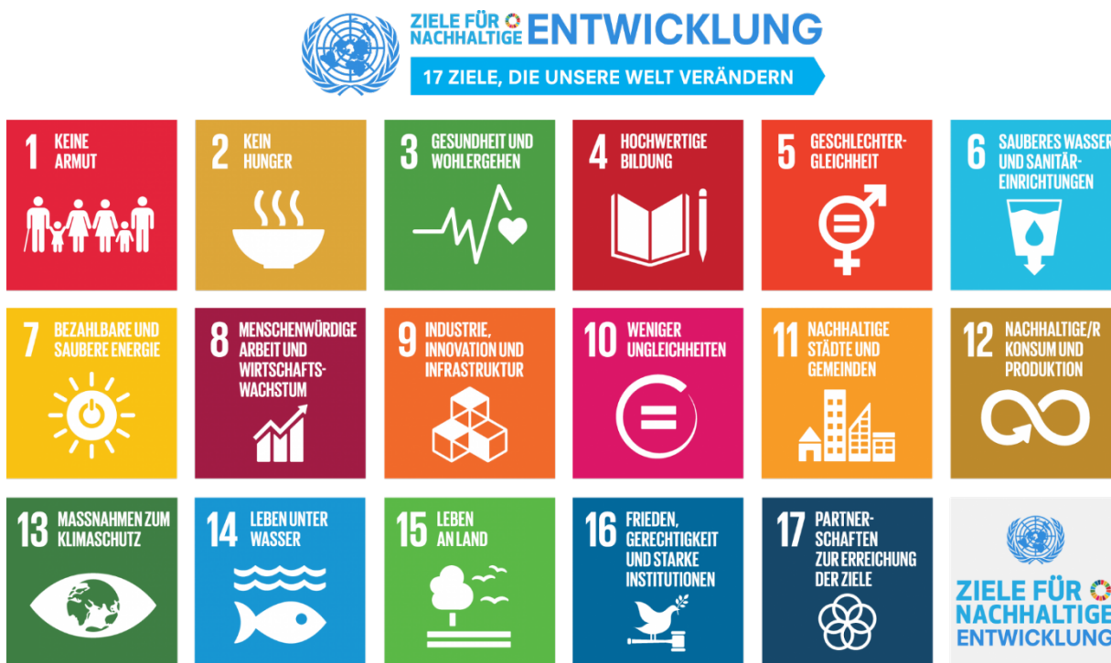
Abbildung 1: Die 17 Ziele für nachhaltige Entwicklung der Agenda 2030 der UNO.

Auf internationaler Ebene ist die nachhaltige Beschaffung Teil der Agenda 2030 der UNO. Diese Agenda, die seit 2016 in Kraft ist, gliedert sich in 17 Ziele und 169 Unterziele für nachhaltige Entwicklung (SDGs). Alle 193 UNO-Mitgliedsstaaten haben sich verpflichtet, diese Ziele bis 2030 zu erreichen.